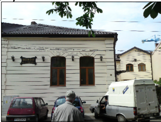
Fatada str Marasesti