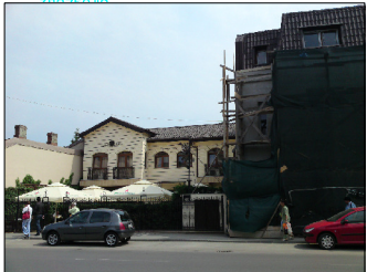
Fatada str Take Ionescu